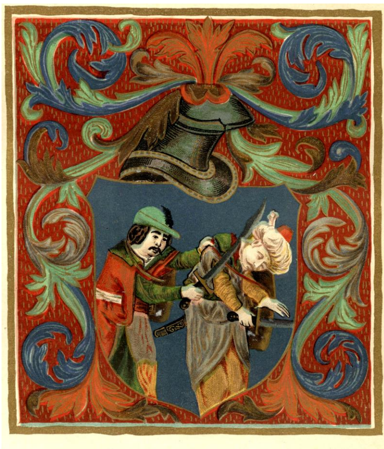
Erb rodu Dombay z roku 1506