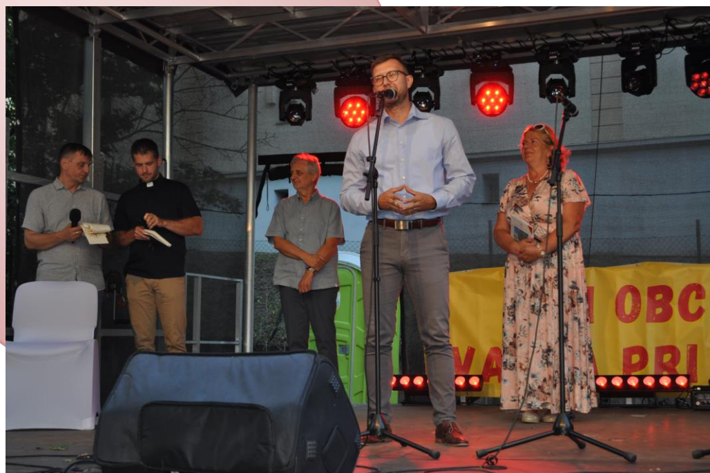
Krst obrazovej publikácie o Ivanke pri Nitre v rámci Dní obce Ivanka pri Nitre, 6. 7. 2024.