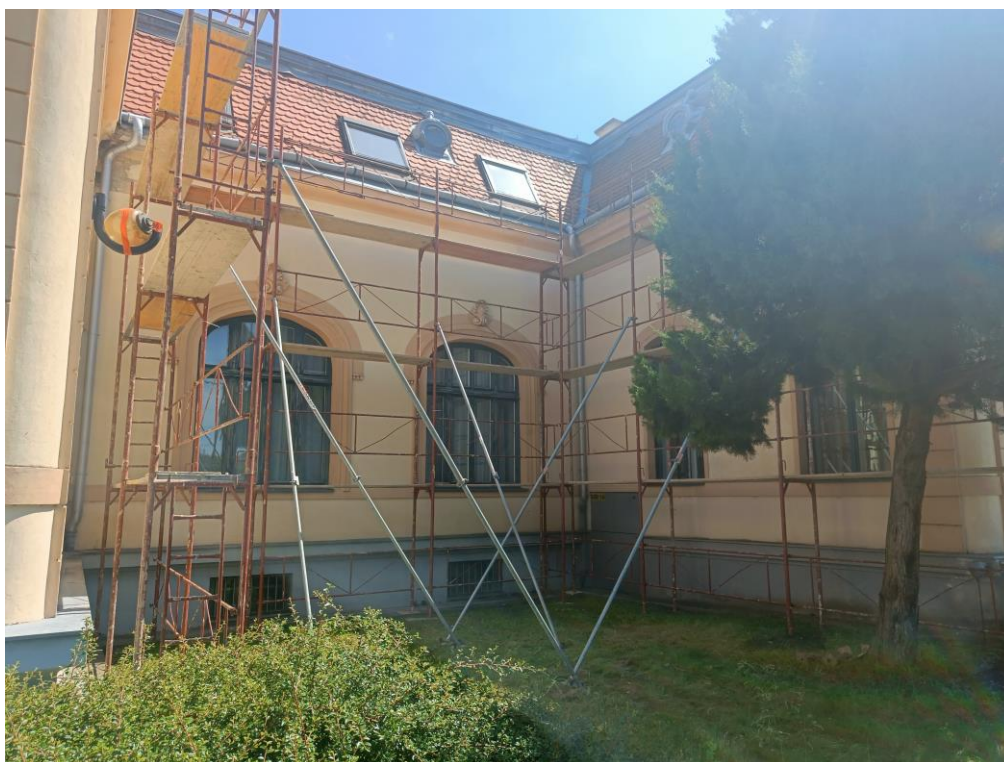
Výmena secesnej rímsky, dažďových zvodov a okapového plechu na objekte Štátneho archívu v Nitre v lete 2024.