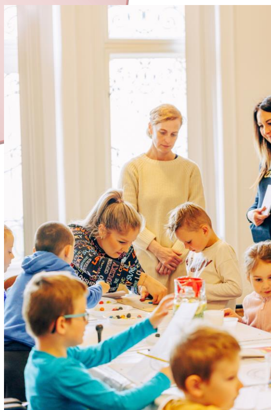
Z exkurznej a prednáškovej činnosti Štátneho archívu v Nitre v roku 2024.