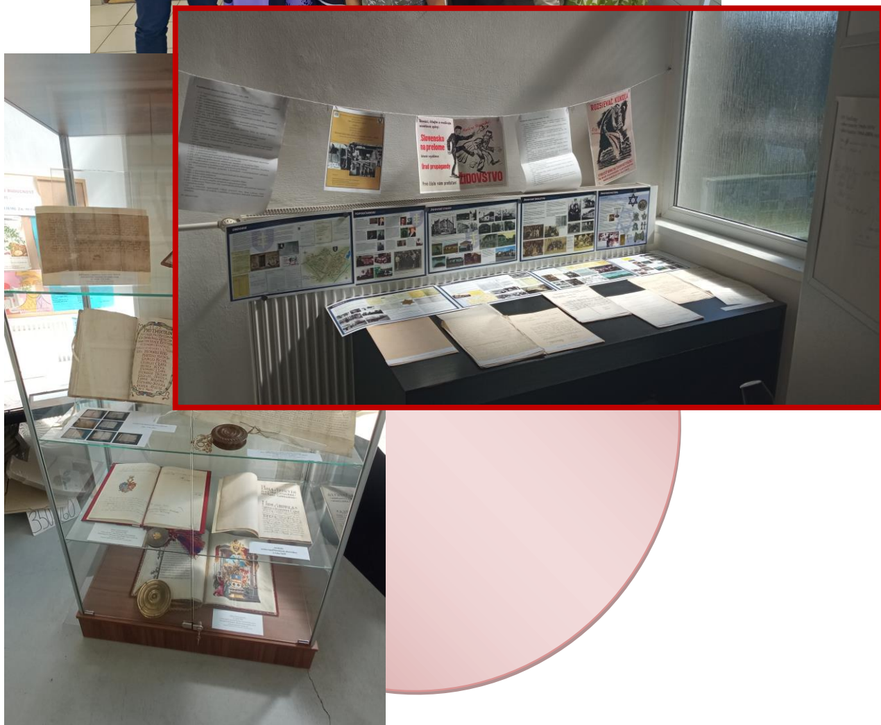
Deň otvorených dverí a výstava v Archíve Topoľčany, 25. 6. 2024.