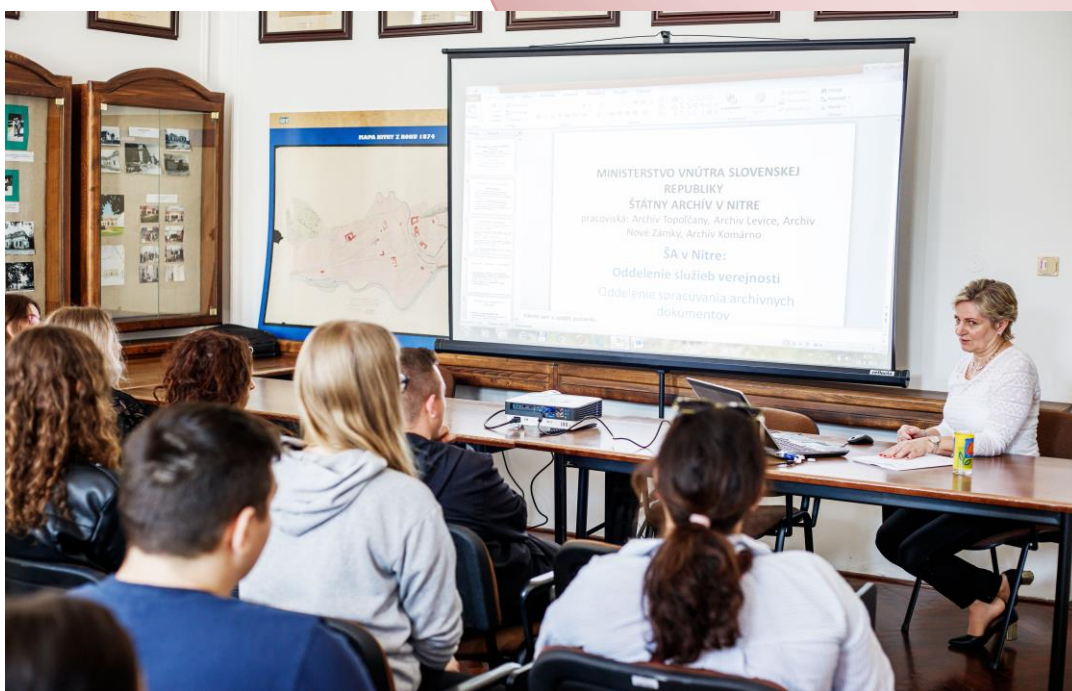
Z exkurznej a prednáškovej činnosti Štátneho archívu v Nitre v roku 2024.