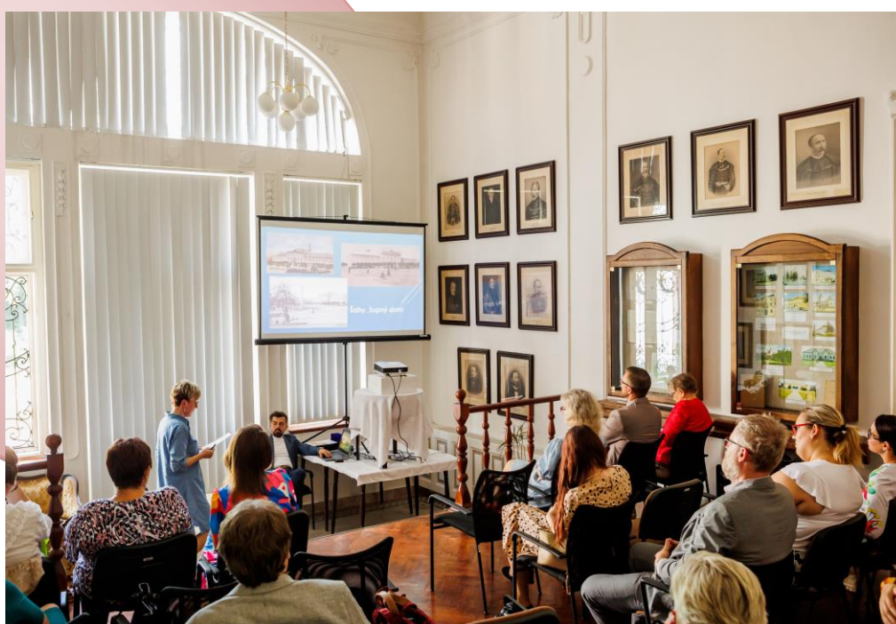
Sedemdesiatka na krku. Odborný seminár k 70. výročiu organizovaného archívnickva na Slovensku a vzniku Štátneho archívu v Nitre, 30. 5. 2024 Ivanka pri Nitre.