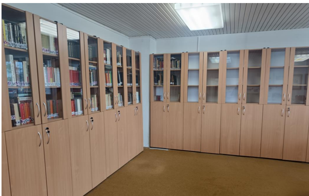
Komplexná výmena nábytku v Archíve Nové Zámky v roku 2024.