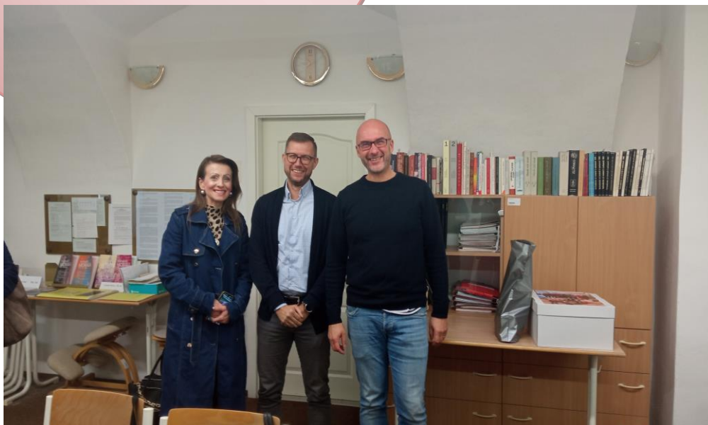
Tradičné stretnutie Archívu Topolčany so svojimi kolegami z partnerského archívu – Štátneho okresného archívu v Zlíne, 24. 10. 2024, Zlín.