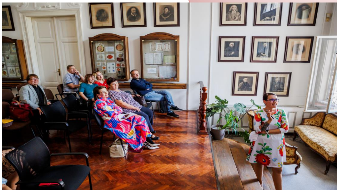
Sedemdesiatka na krku. Odborný seminár k 70. výročiu organizovaného archívництва na Slovensku a vzniku Štátneho archívu v Nitre, 30. 5. 2024 Ivanka pri Nitre.