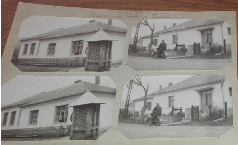
Národná škola v Ďurďoši stavba z r. 1934 na školské účely sa využívala od r. 1934

Osemročná stredná škola - Bystrom n.T. str. Ľ. Ľ. Ľ.