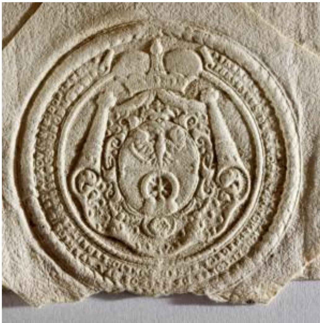
Obr. 2 – pečať Františka II. Rákocziho na dokumente z roku 1705

Jeho pečať na poslednej strane dokumentu má okrúhly tvar, s priemerom 55 mm. Je pritlačená, s papierovou clonou. Pečatnou látkou je červený vosk. V pečatnom poli je kartuša s erbom. V delenom štíte, v hornom poli orol s rozťahnutými krídlami, v pravici so šablou, v dolnom poli z trojvršia vyrastá koleso. Za štítom je hermelínom podšitý plášť, splývajúci z kniežacej koruny. Kruhopic je pravotočivý, odstredivý, v dvoch riadkoch (1:00-11:00). Tvorí ho text: • FRANCISCVS DE RA[KOCZI] [...]LI • COMES DE RAKOS DVX [...]SIE • ET [...]XCVICSIZ • DOMINVS // PHR[...]JES • ET SAROS [...] • TOKAI REGE[...] [...]. Jazyk je latinský, písmo kapitála – majuskula. Vnútorňa a vonkajšia linka je tvorená girlandou.