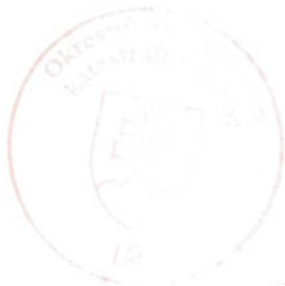
Mgr. Uršula Kubíková

Toto rozhodnutie je podľa § 177 a nasl. zákona č. 162/2015 Z. z. Správny súdny poriadok preskúmateľné súdom po nadobudnutí právoplatnosti.