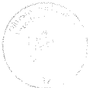
Mgr. Uršula Kubíková

Toto rozhodnutie je podľa § 177 a nasl. zákona č. 162/2015 Z. z. Správny súdny poriadok preskúmateľné súdom po nadobudnutí právoplatnosti.